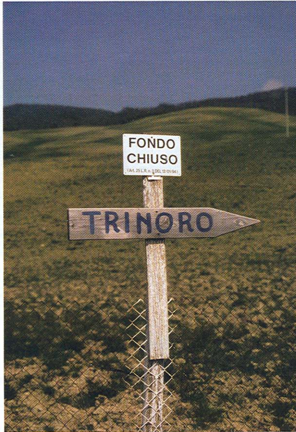
Dritte Kreuzung rechts: Wer die Tenuta di Trinoro besuchen will, sollte den Weg zum Weingut schon vorab studieren.