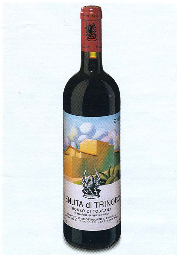
La Primadonna: Nur 4000 bis 6000 Flaschen des Tenuta di Trinoro kommen jedes Jahr weltweit auf den Markt.